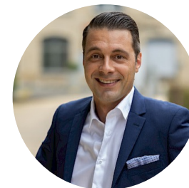
DANILO DELLA CA NÜSSLI (Schweiz) AG Hüttwilen